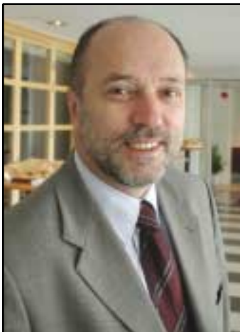
Refik Sener, dokumenterade konferensen.